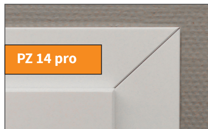
PZ 14 pro

Herkömmliche Zarge mit unerwünschter Spaltbildung im Gehrungsschnitt