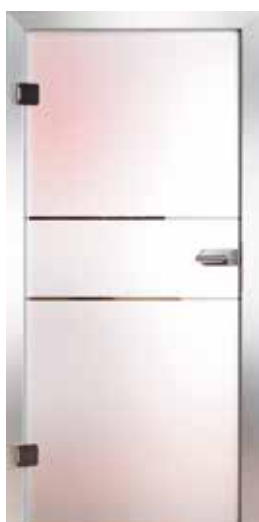
3221 „Unit I“