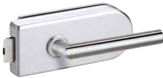
418 EE Oberfläche: Edelstahl

Diese ausgewählten Modelle aus unserer loft Glastürenkollektion erhalten Sie in den Größen 709 / 834 / 959 x 1972 mm inklusive Beschlag innerhalb von nur 3 bis 5 Tagen.