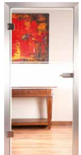
3222 „Unit II“