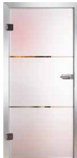
3257 „Unit III“