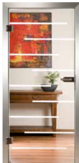
3083 „Stripes II“